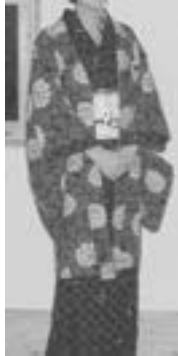
時代布池田 東京都港区白金台 5-22-11 ソフトタウン白金 101 Tel03-3445-1269